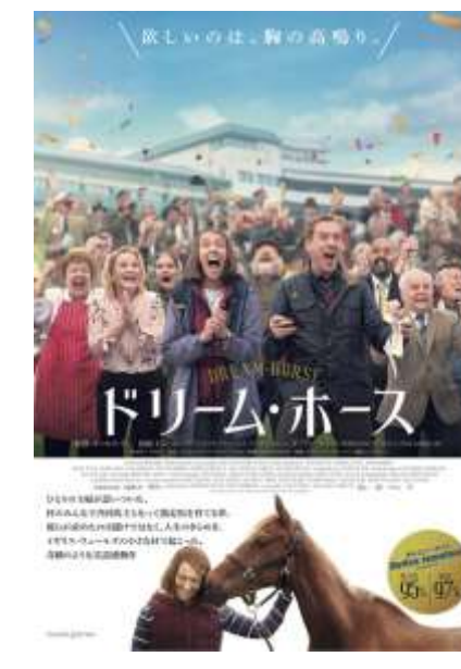
© 2020 DREAM HORSE FILMS LIMITED AND CHANNEL FOUR TELEVISION CORPORATION

出演：トニ・コレット、ダミアン・ルイス 2020年製作／113分／G／イギリス 配給：ショウゲート 非劇窓口：BBB