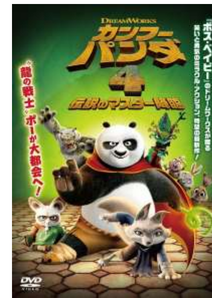
© 2024 DreamWorks Animation LLC. All Rights Reserved.

日本語吹替：佐藤せつじ、冠野智美 2024年製作／94分／アメリカ 配給：UIP