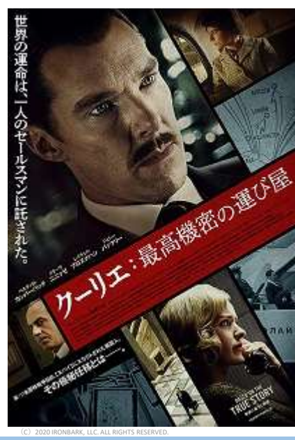
© 2020 MGBANK, LLC. ALL RIGHTS RESERVED.