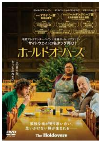
(C) 2023 MIRAMAX DISTRIBUTION SERVICES, LLC. ALL RIGHTS RESERVED.

監督: クリストファー・ノーラン 出演: キリアン・マーフィ、エミリー・ブラント 2024年製作 / 180分 / R15+ / アメリカ 配給: UIP ※2024年12月使用解禁