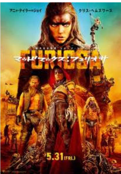
© 2024 Warner Bros. Entertainment Inc. All Rights Reserved.

出演: ポール・ジアマッティ、ドミニク・セッサ 2023年製作 / 134分 / PG12 / アメリカ 配給: UIP ※2024年12月使用解禁