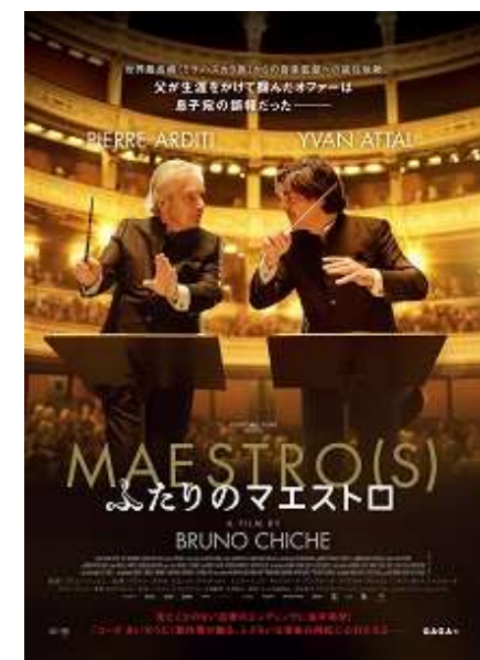
© 2023 VÉNDÔME FILMS - ORANGE STUDIO - ARLO LA FILMS