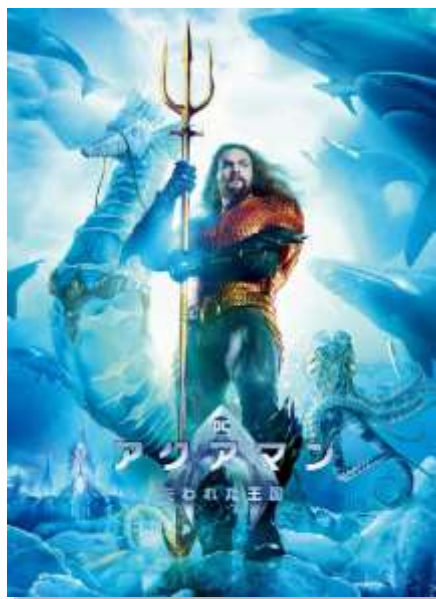
DC LOGO, AQUAMAN and all related characters and elements © & ™ DC. © 2023 Warner Bros. Entertainment Inc. All rights reserved.