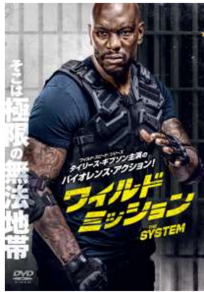
(C) 2022 Behind Bars LLC. All Rights Reserved.

2024年製作／166分／G／アメリカ 配給：ワーナー・ブラザーズ映画 ※2024年9月解禁