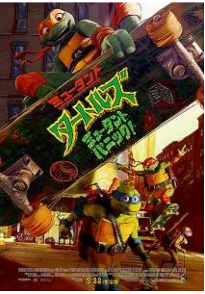
TEENAGE MUTANT NINJA TURTLES IS A TRADEMARK OF VIACOM INTERNATIONAL INC.